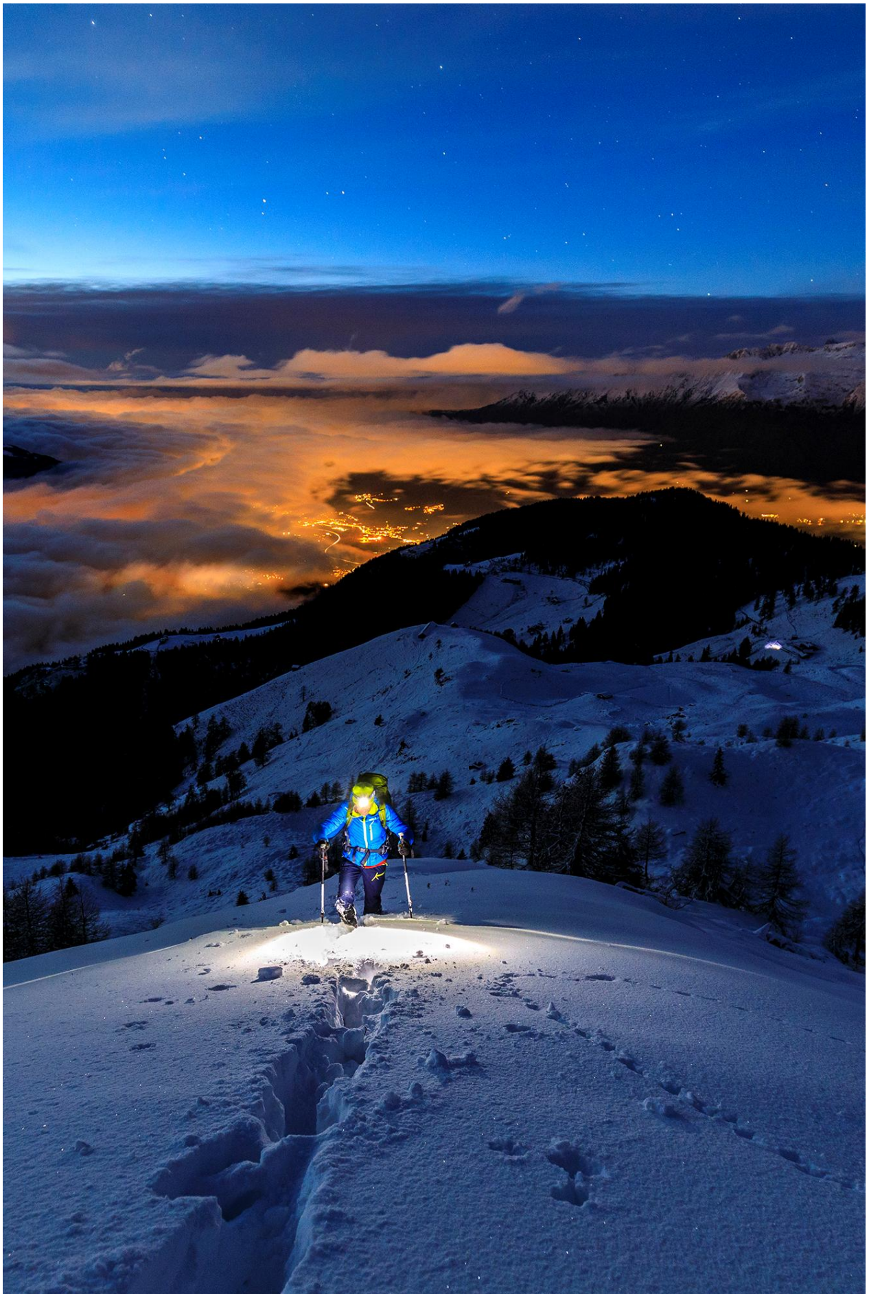
copertina della rivista Orobie - dicembre 2021 – notturna invernale in Alpe Piazza